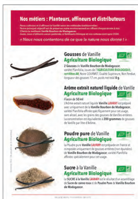
50 Flyers 10 x 15 cm

Ces différents supports de communication vous sont offerts avec le Kit Epicerie Fine.